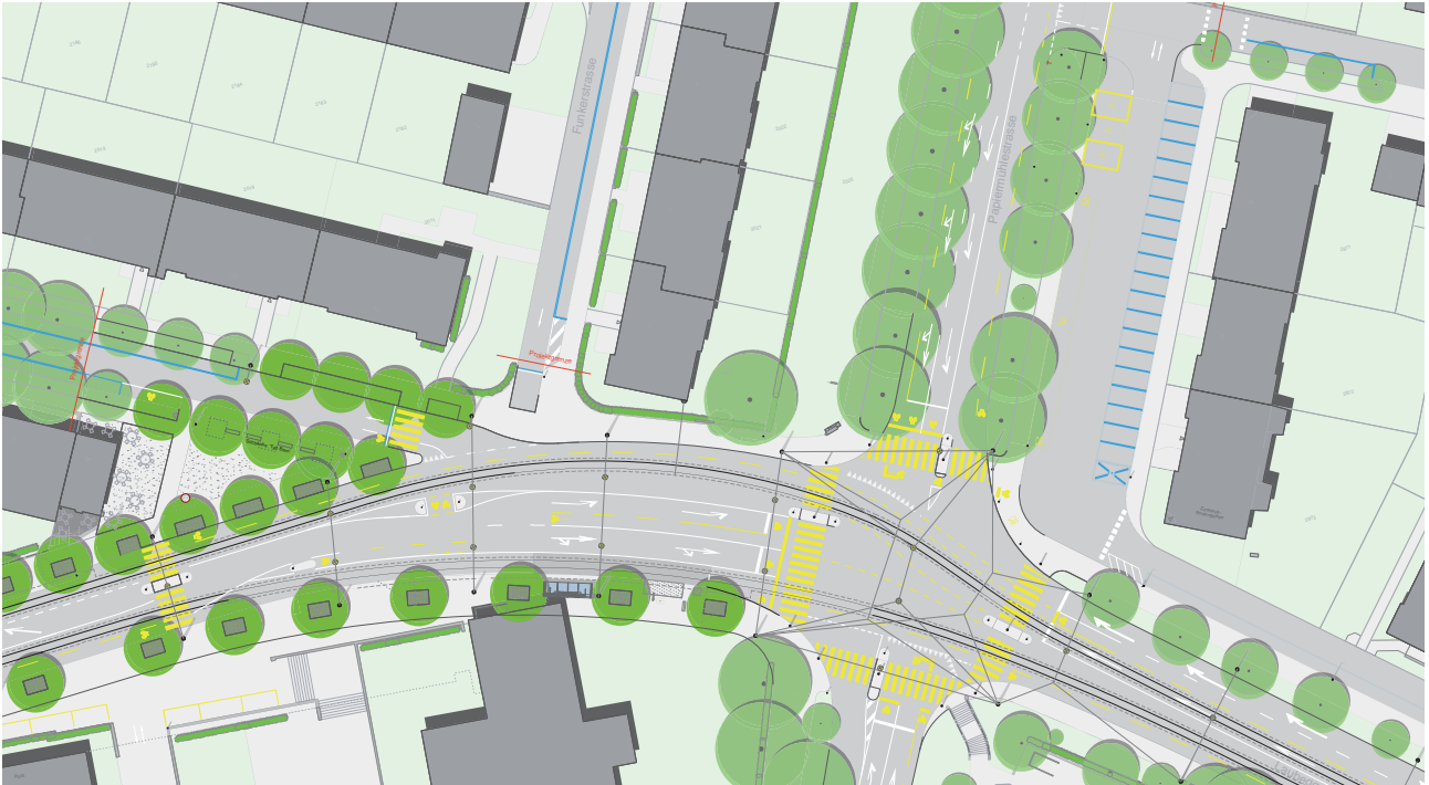
Kreuzung Schönburg / Rosengarten, Auflageprojekt 2013 (Ausschnitt)