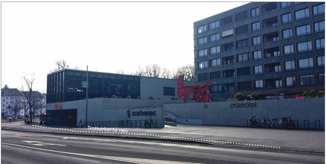
Foto mit Situation Schönburg, Zugang Coop und Hotel, Zustand 7.3.2021