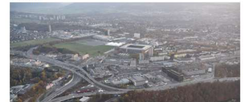
ESP Wankdorf Richtplan

Kanton Bern – Stadt Bern – Ittigen – Ostermundigen – Bürgergemeinde Bern – BERNEXPO – armasuisse – BBL – SBB