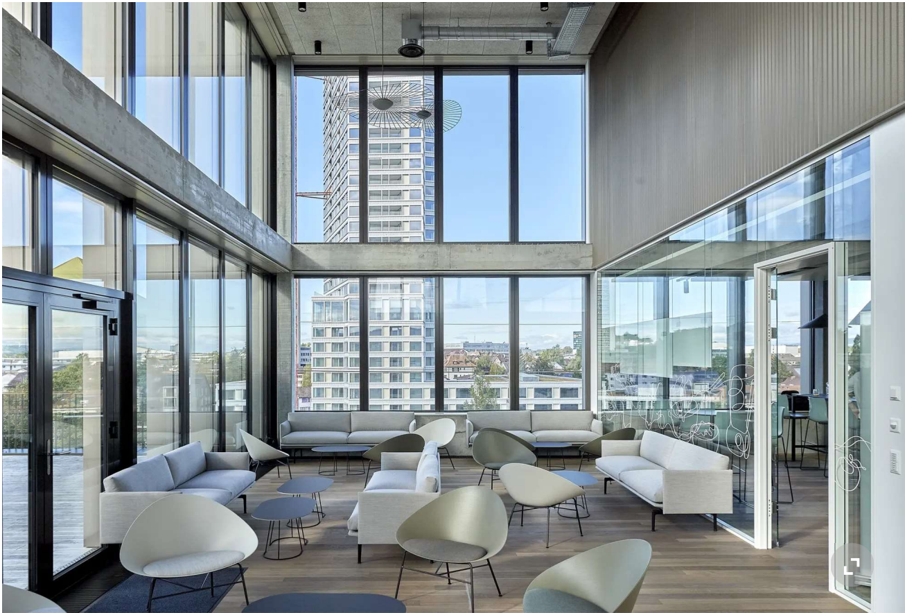
Lounge des TCS-Büros in Ostermündigen.

«Nach der Pandemie haben sich viele Angestellten gesagt, mein Büro ist schlecht für mich, lieber bleibe ich zu Hause, wo ich mich besser konzentrieren kann.» Um diese Leute wieder zurück ins Büro zu holen, genüge es nicht, einfach ein paar Sofas in eine Ecke zu stellen.