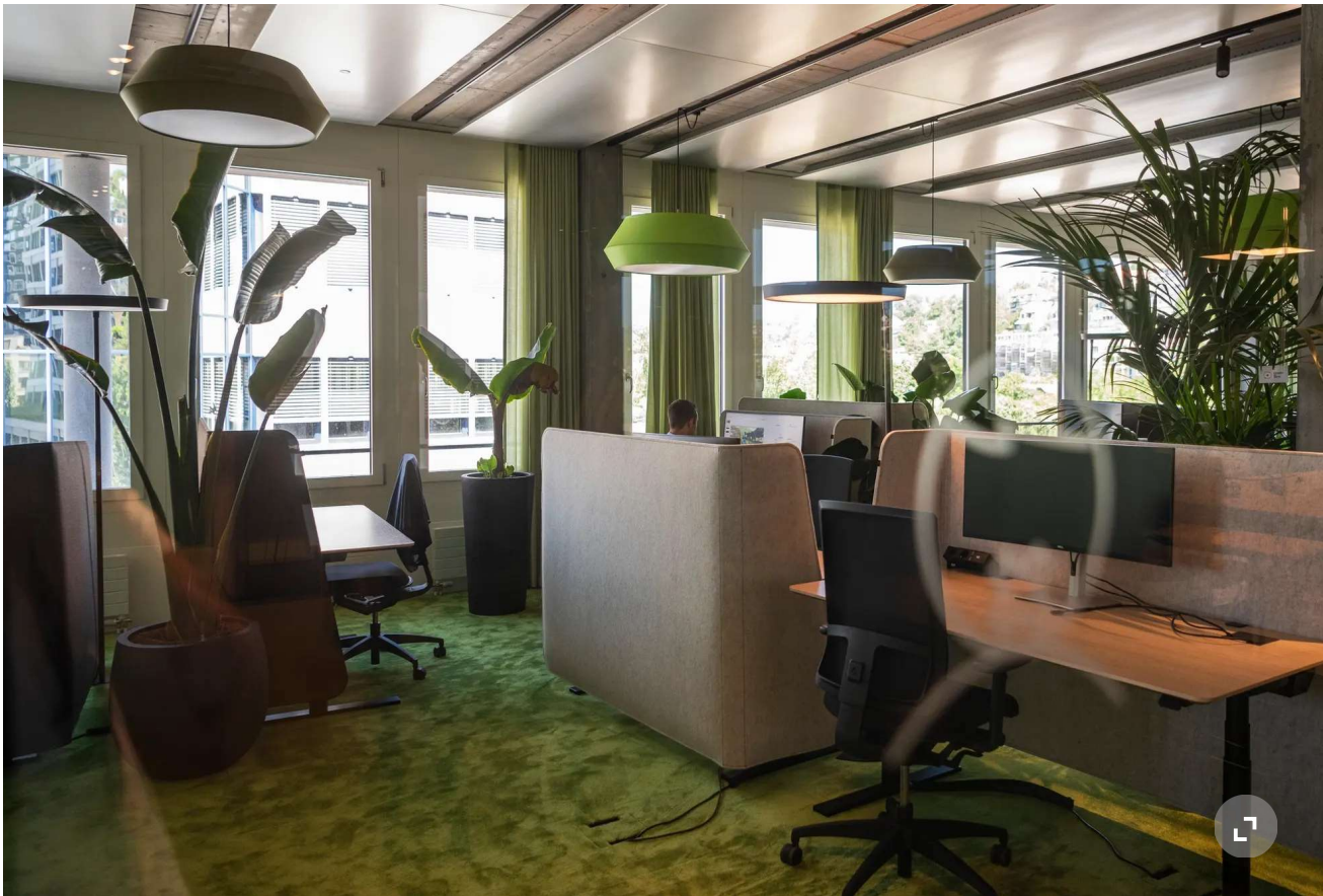
Das Büro wird wohnlicher: Arbeitsplätze von Barry Callebaut in Zürich.