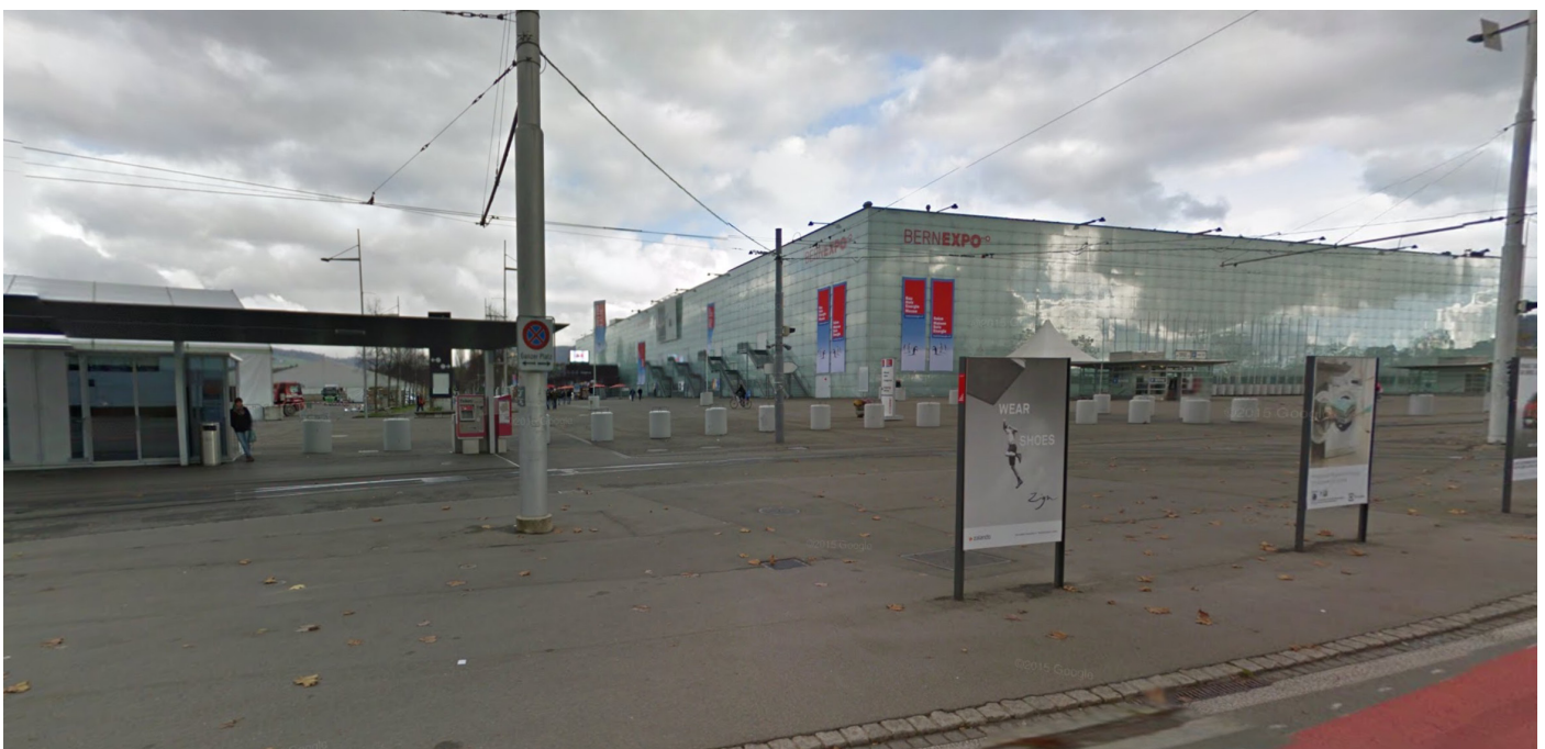
Bild 4: Situation Guisanplatz, sogar die Wendeschleife der Tramanlage ist mit Asphalt versiegelt.