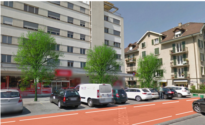
Bild 5: Scheibenstr., Sichtbarkeit der Fussgängerverbindung verbessern