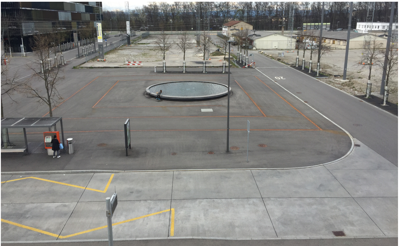
Bild 3: Rosalia Wenger Platz, Wankdorf City, viel Asphalt - keine Grünfläche