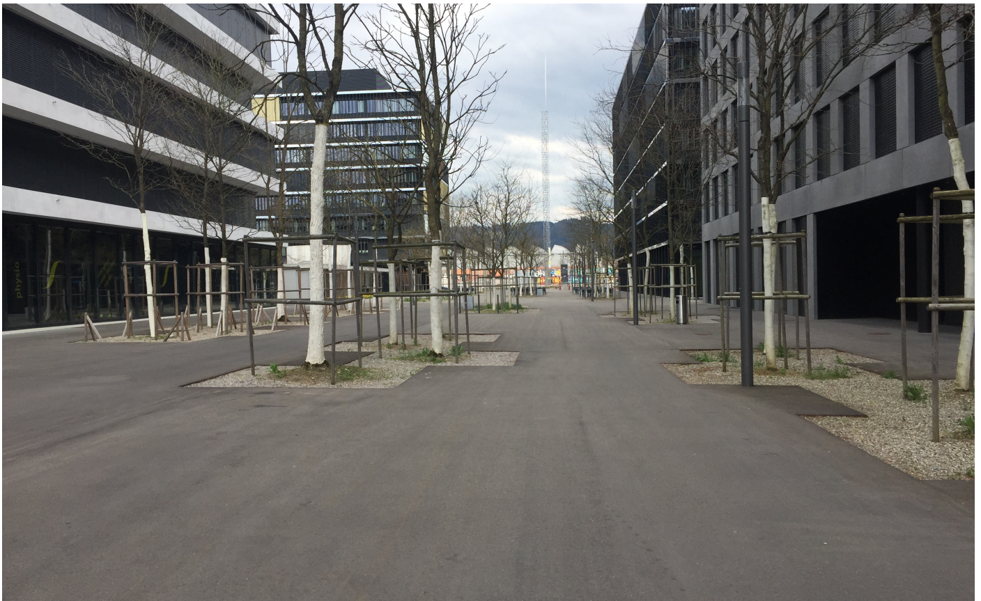
Bild 2: Hauptachse Wankdorf City, aus dem Asphalt gestanzte Kiesflächen

Die Anwesenden Mitarbeiter vom Stadtplanungsamt haben uns versichert die Planung der Aussenräume ganz eng begleitet zu haben. Wir halten die Aussenraumgestaltung in diesem neu gebauten Quartier für gescheitert. Wir unterstellen: Es wird zuviel gedacht, zuviel geplant, man will zu sehr gefallen. Wir plädieren für weniger versiegelte Fläche, für mehr grüne Inseln und normale Parks mit Bäumen und allenfalls einem Kiosk mit WC-Anlage.