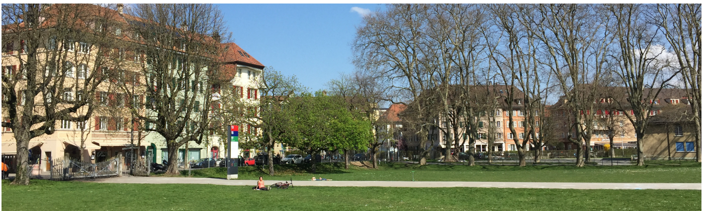
Bild: Kasernenwiese Breitenrain, stimmiger Erholungsraum

Das beworbene Freiraumkonzept gab uns die Hoffnung, dass die Stadt einen Paradigmawechsel vollzieht und der Freiraumplanung in Zukunft das Gewicht gibt, das sie verdient. Wir fanden es etwas überraschend, dass nach dem STEK 2016 nochmals als Folgearbeit ein umfangreiches Konzept vorgelegt wird, welches wenige zusätzliche Vertiefungen enthält. Insgesamt ist das Freiraumkonzept eine schwere Kost für die BewohnerInnen und es ist leider nicht sehr leicht lesbar. (Am zielführendsten fanden wir noch die Projekttafel, welche konkretere Ideen vermuten lässt und endlich einen Überblick erlaubt.) Zugleich wird die Partizipation der Bevölkerung im Konzept als sehr wichtig dargestellt. (s. 72, ff) Wir hätten uns eine einfachere Art und Weise gewünscht - weniger wäre hier mehr und günstiger gewesen.